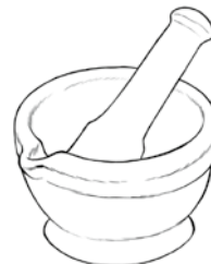
Un mortier pour écraser