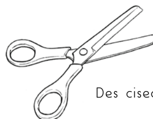
Des ciseaux pour couper